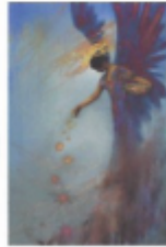
Gute Geister, Engel